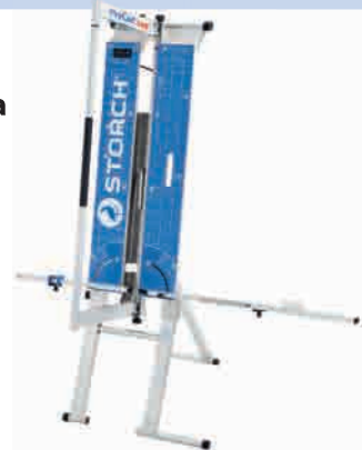
obj. č. 57 00 30