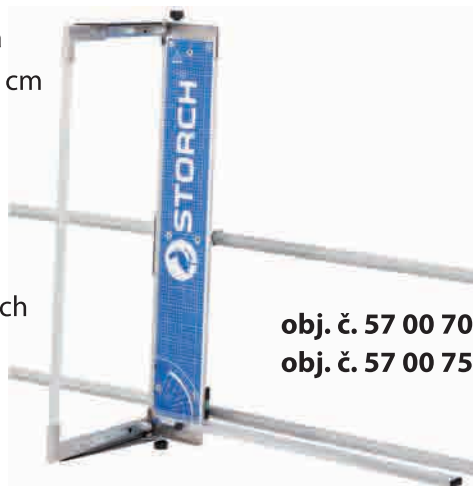
obj. č. 57 00 70