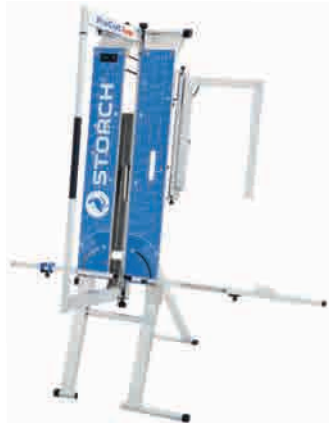
obj. č. 57 00 35