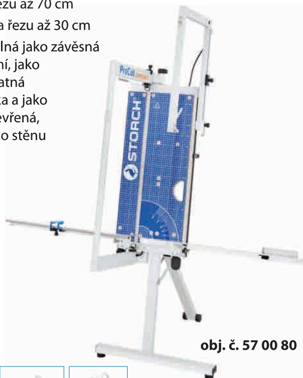
obj. č. 57 00 80