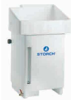
obj. č. 61 20 00