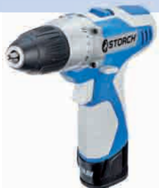
obj. č. 62 00 00