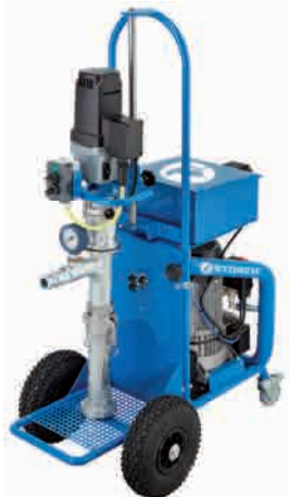
obj. č. 64 05 00