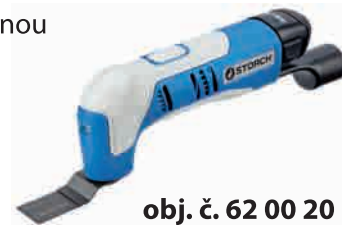
obj. č. 62 00 20