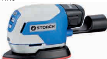
obj. č. 62 00 10