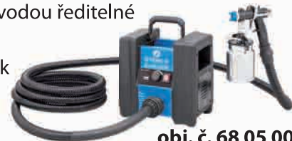
obj. č. 68 05 00