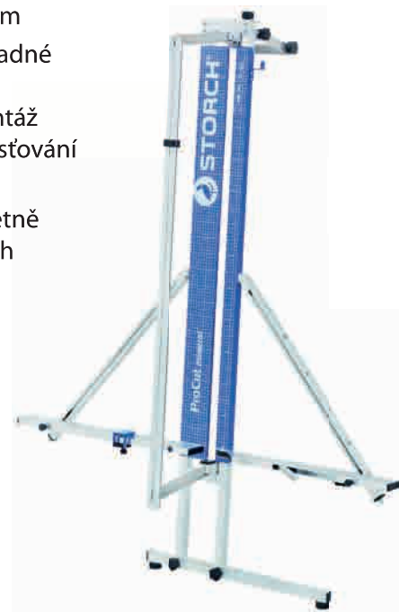
obj. č. 57 00 90