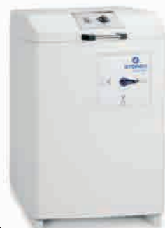
obj. č. 61 30 30