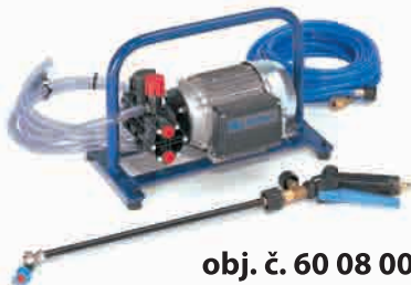
obj. č. 60 08 00