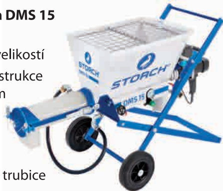
obj. č. 64 34 00