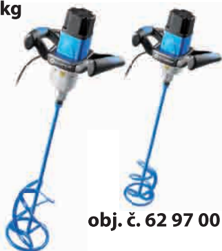
obj. č. 62 98 00