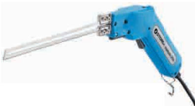
obj. č. 43 61 50