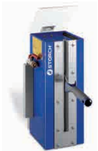
obj. č. 61 20 50