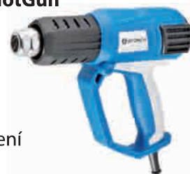
obj. č. 65 57 20