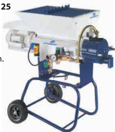
obj. č. 64 35 00