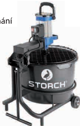
obj. č. 64 55 00