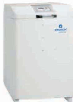
obj. č. 61 30 00